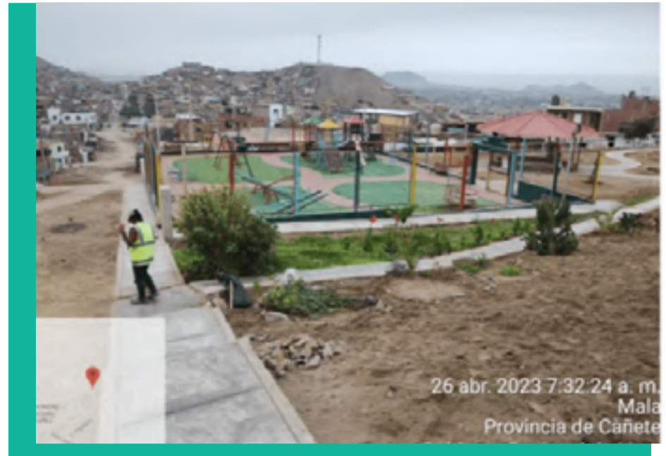
Faenas Urbanas: Orden y limpieza en los 6 anexos