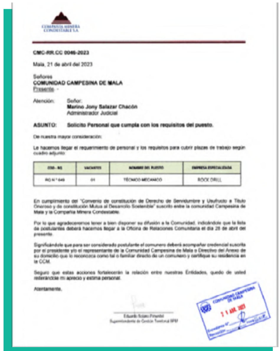
Comunicación a autoridades de la comunidad sobre convocatorias laborales de CMC y empresas contratistas