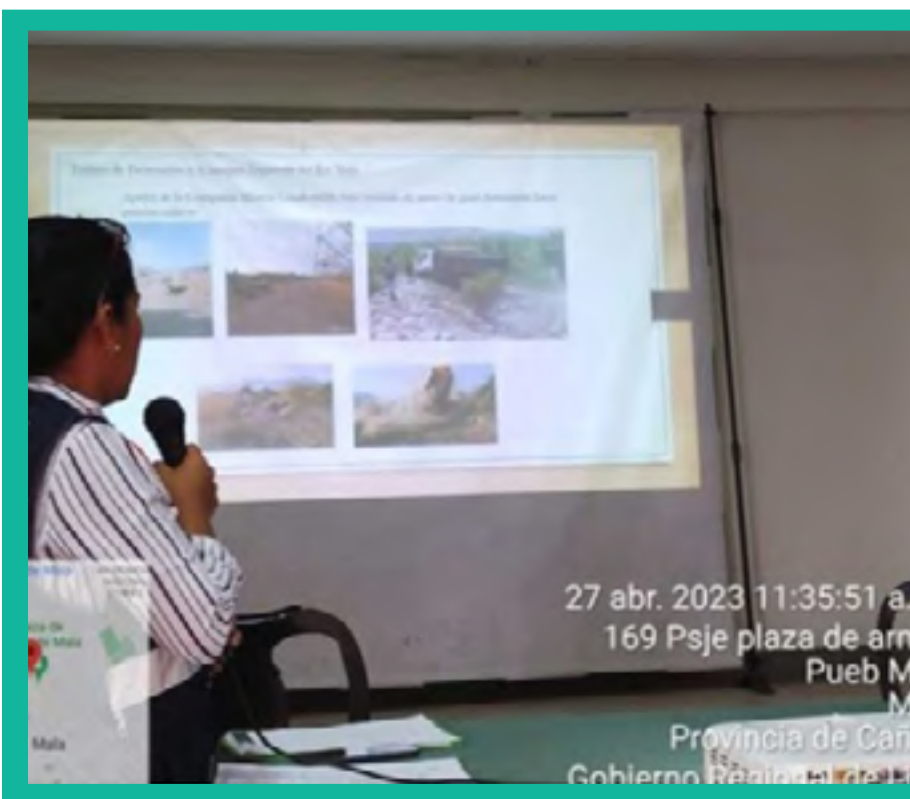
Reunión del Comité Multisectorial de Salud del Distrito de Mala Mala Centro