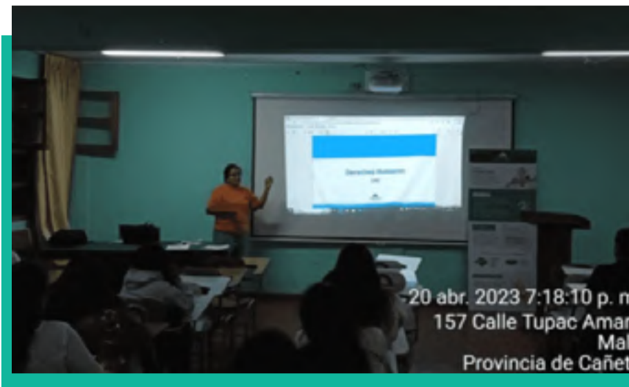
Taller de Derechos Humanos, Código de Ética y Nuevos Canales de Comunicación Instituto San Pedro de Mala