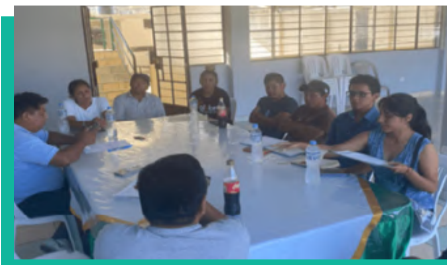
Presentación y Exposición de Proyectos a Desarrollar por Profonanpe

Alcalde de Mala y Representantes de los Anexos de la CCM - Mala Centro y Anexo San Marcos de la Aguada