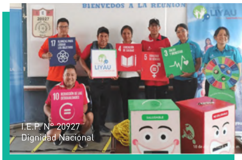
I.E.P. N° 20927 Dignidad Nacional