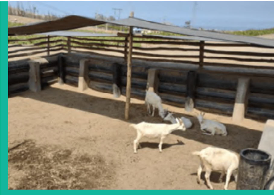
Faenas Ambientales: Crianza de cabras y cuidado de terreno