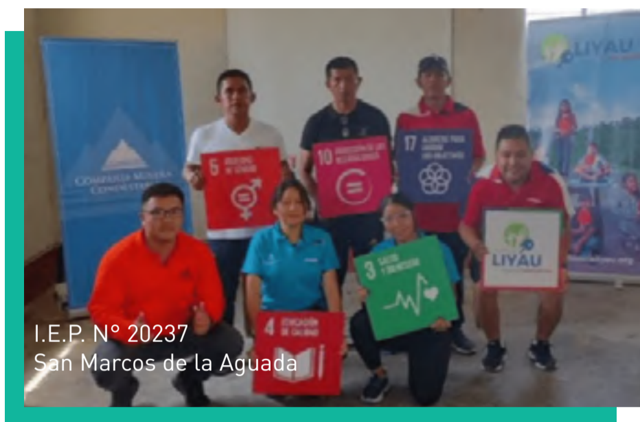
I.E.P. N° 20237 San Marcos de la Aguada