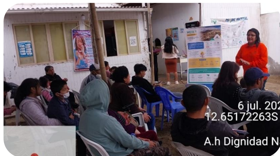
Inicio de la MEIA II Capacitación a instituciones públicas y público en general