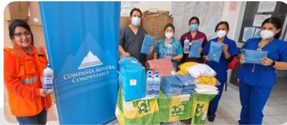
Red de Salud de Chilca - Mala