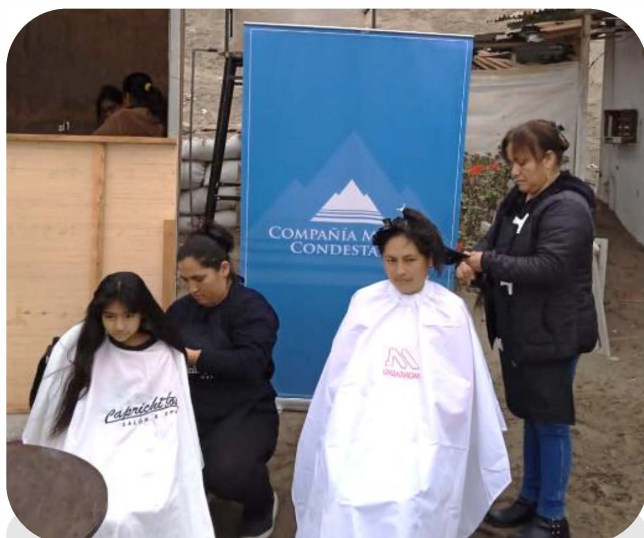
Campaña de corte de pelo

Llevamos a cabo campañas en favor de la salud de la comunidad, como campañas de corte de cabello y campañas médicas, en coordinación con el CETPRO y la Red de Salud Chilca Mala.