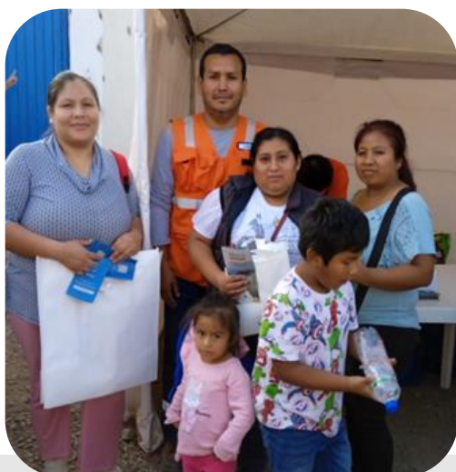
Inicio de la MEIA II Carpa Informativa

Continuamos con el proceso de participación ciudadana informando a la población acerca de la Segunda Modificatoria del Estudio de Impacto Ambiental por medio de diversos mecanismos de comunicación (carpas informativas, capacitaciones y banners informativos).