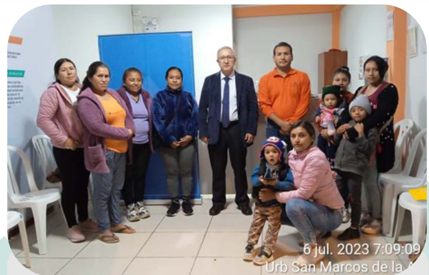
Capacitación "Prevención Violencia Familiar"

Desarrollamos diferentes talleres de orientación familiar, con la finalidad de preservar una convivencia armoniosa dentro de las familias de la Comunidad Campesina de Mala.