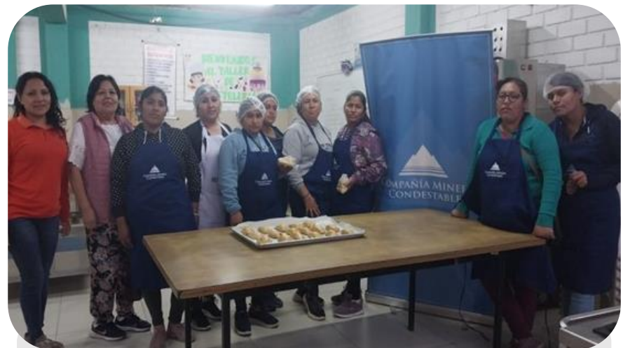
Taller de repostería – CETPRO

En convenio con el CETPRO (Centro de Educación Técnico-Productiva del distrito de Mala) venimos realizando capacitaciones a los miembros de la Comunidad Campesina de Mala, a fin de generar nuevos conocimientos para la creación de emprendimientos.