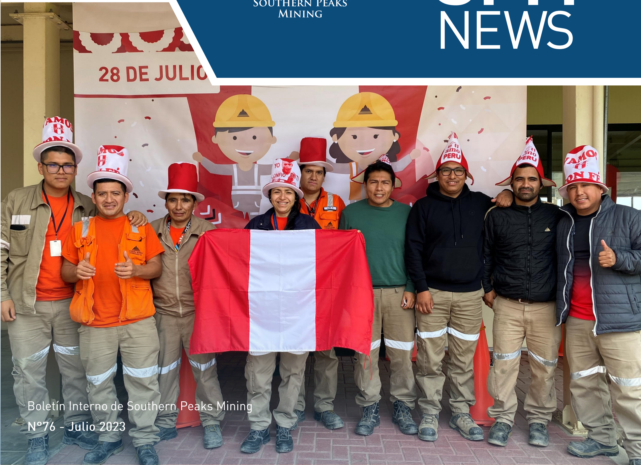
Boletín Interno de Southern Peaks Mining N°76 - Julio 2023