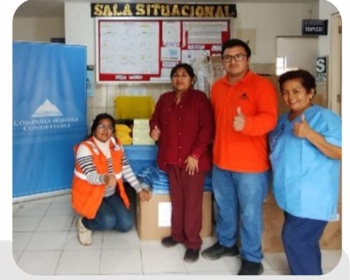
Posta de Salud Dignidad Nacional Zona norte