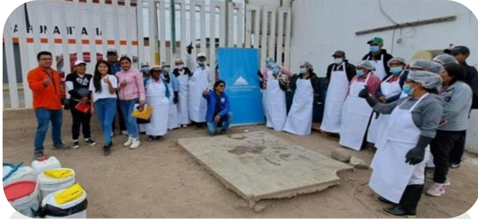
Fabricación de biofertilizantes

Se vienen realizando diversas actividades en convenio con PROFONANPE (Fondo Nacional para Áreas Naturales Protegidas por el Estado), con la finalidad de utilizar prácticas económicamente rentables, social y ambientalmente responsables, a fin de garantizar un desarrollo de calidad sin comprometer los recursos de la comunidad.