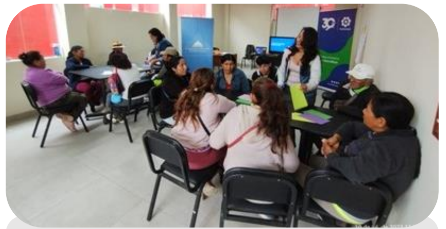
Fabricación de subproductos derivados del tallo del árbol del plátano