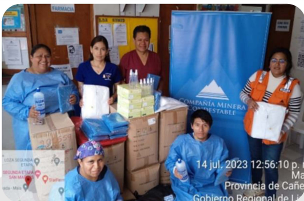
Posta de Salud San Marcos De la Aguada Zona Centro

Con el objetivo de promover la salud y la prevención, realizamos la donación de elementos de bioseguridad a los diferentes establecimientos de salud de la zona.