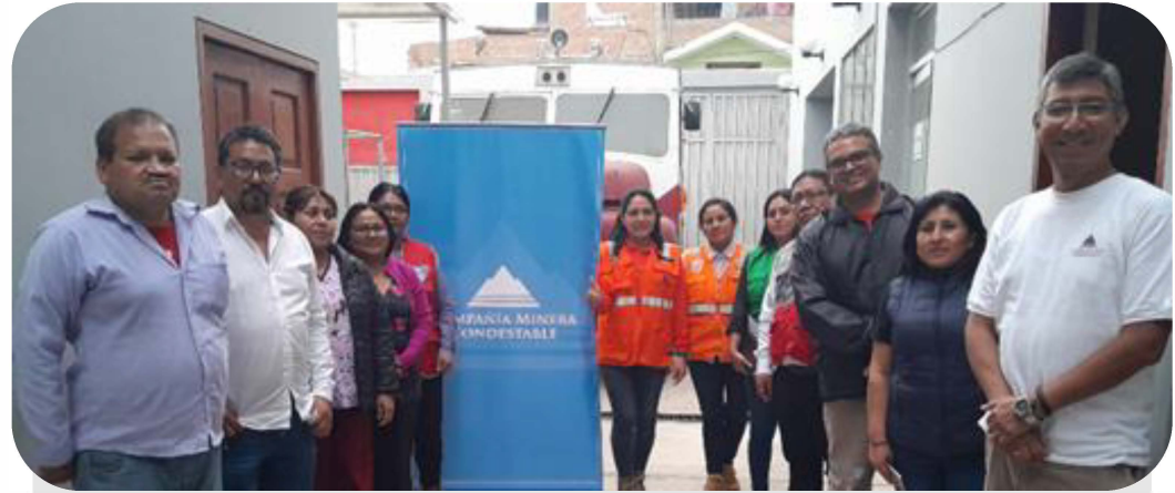
Comité de Salud y Seguridad en la Comunidad

Se llevaron a cabo diversas reuniones con el Comité de Salud y Seguridad en la Comunidad, en el cual se integran diferentes representantes de las instituciones públicas del distrito de Mala y con las cuales buscamos asegurar la salud y la seguridad dentro de la Comunidad Campesina de Mala.