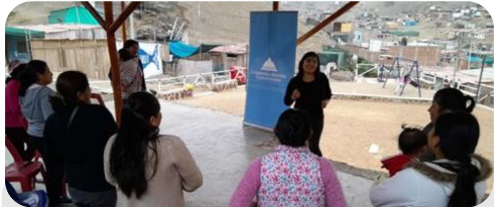
Capacitación "Uso responsable del agua"

Continuando con las actividades de mejora y saneamiento de los diferentes comedores populares que se encuentran activos dentro de la Comunidad Campesina de Mala, se vienen desarrollando capacitaciones a las diferentes directivas de los mismos sobre temas de gestión ambiental.