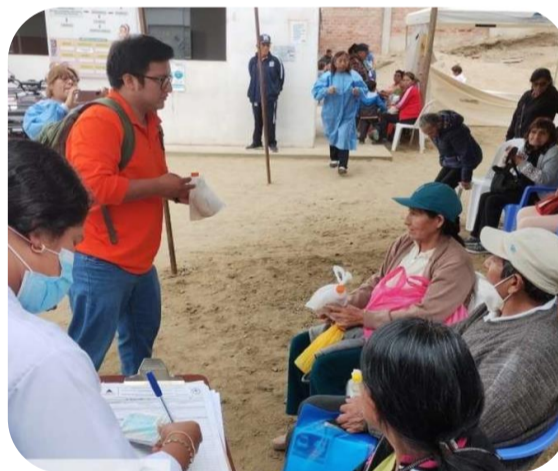
Apoyo logístico para la atención del adulto mayor, Posta de Dignidad Nacional (Zona Norte)