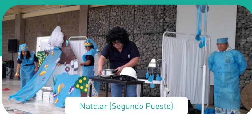
Natclar (Segundo Puesto)