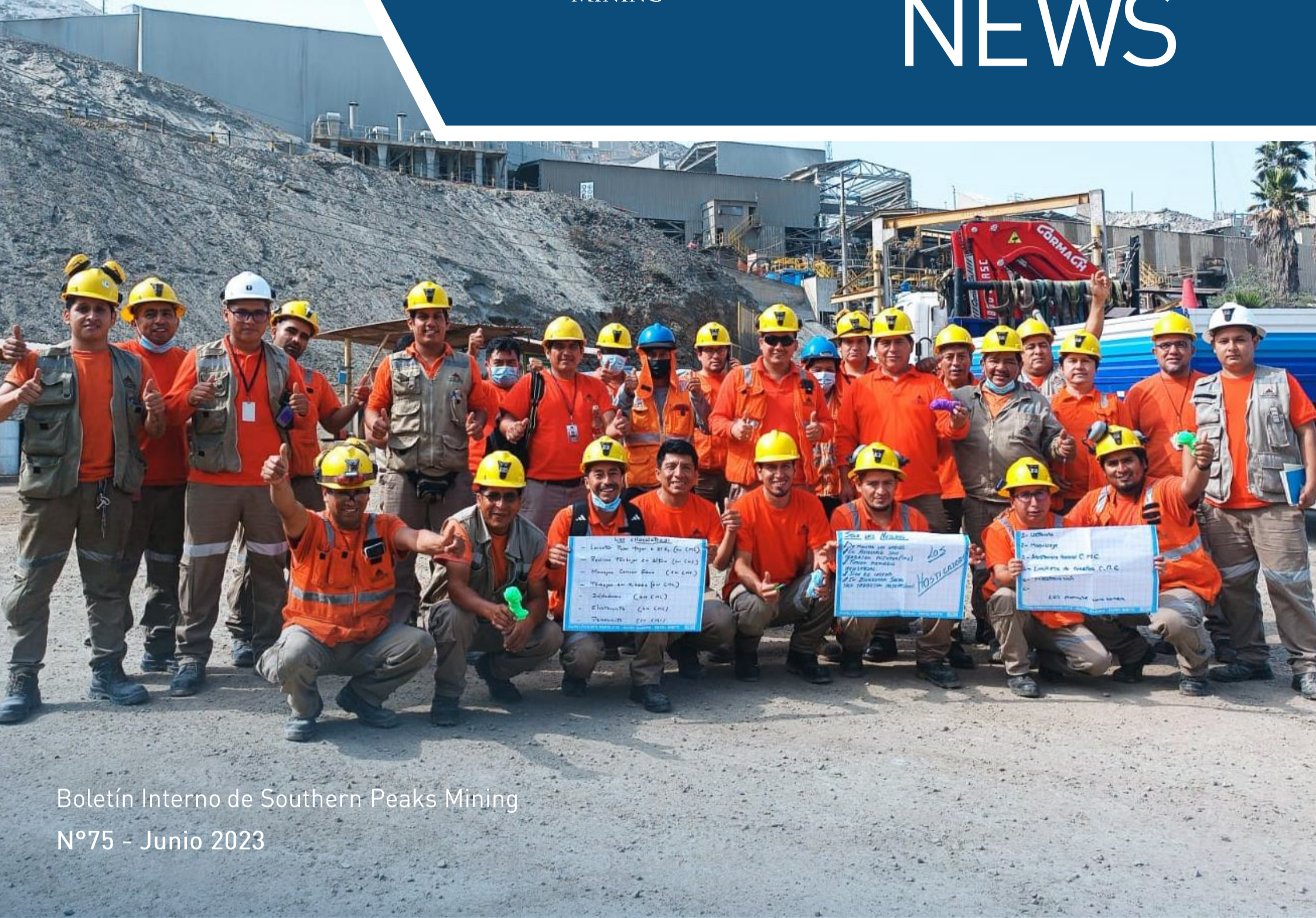
Boletín Interno de Southern Peaks Mining N°75 - Junio 2023