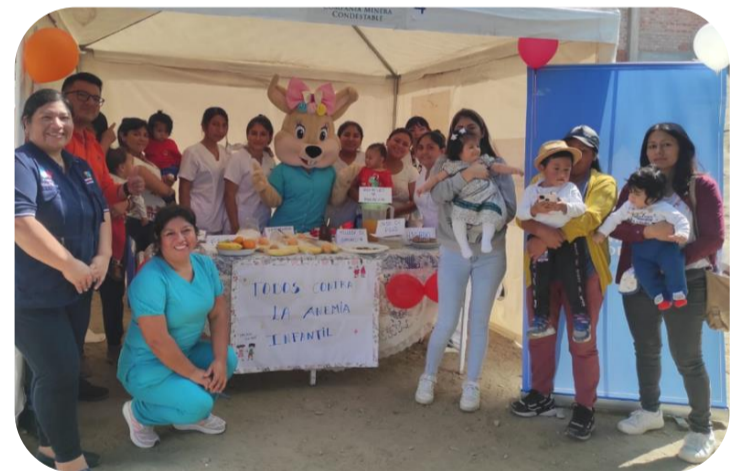
Apoyo logístico para Taller de Alimentación Saludable, Puesto de Salud Dignidad