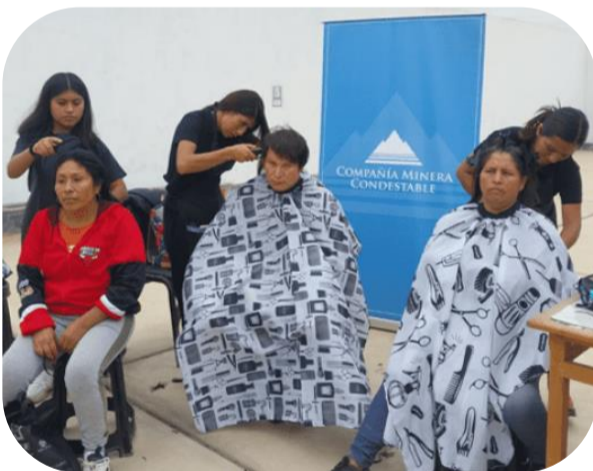
Campaña de corte de pelo, Anexo San Marcos de la Aguada