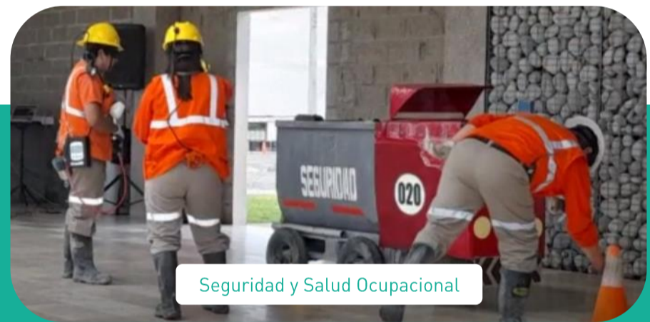
Seguridad y Salud Ocupacional