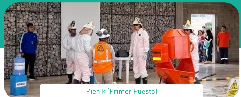
Pienik (Primer Puesto)