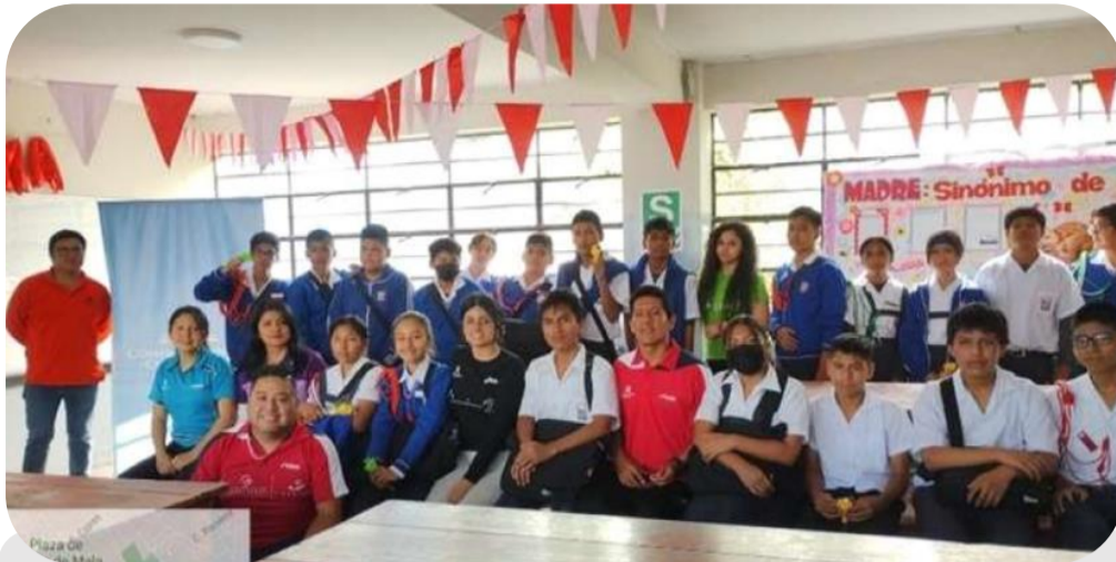
Distrito de Mala I.E.P. Dionicio Manco Campos