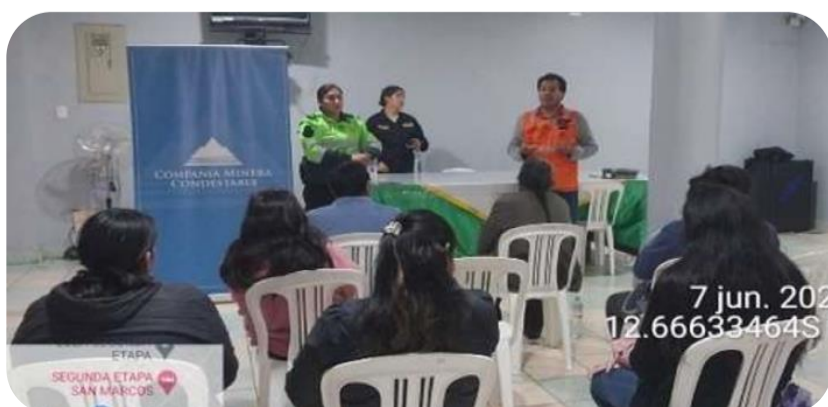
Charla Preventiva contra la Violencia Familiar y Establecimiento de Normas de Convivencia, en coordinación con la PNP del distrito de Mala.