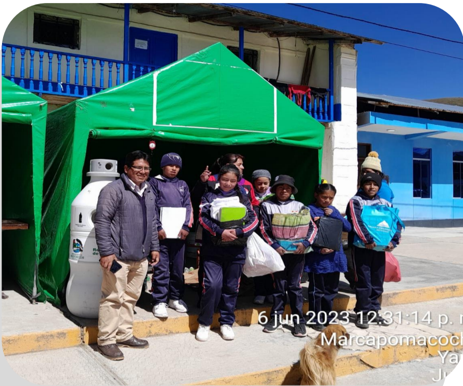
Feria Ecotrueque Marcapomacocha, Yauli, Junín

La Municipalidad Distrital de Marcapomacocha realizó la feria “Ecotrueque” la cual tuvo como finalidad promover el reciclaje de materiales aprovechables, tales como plásticos y cartones en las viviendas de los vecinos. En este espacio se brindó información sobre el proyecto Ariana, las etapas del proyecto minero y el III Informe Técnico Sustentatorio.