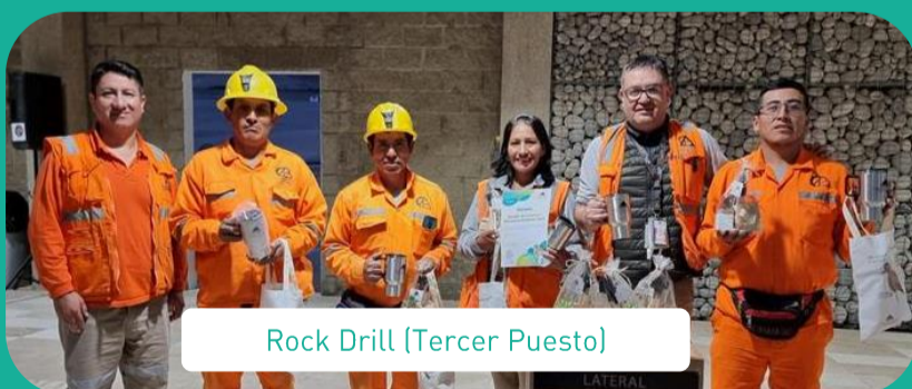
Rock Drill (Tercer Puesto)