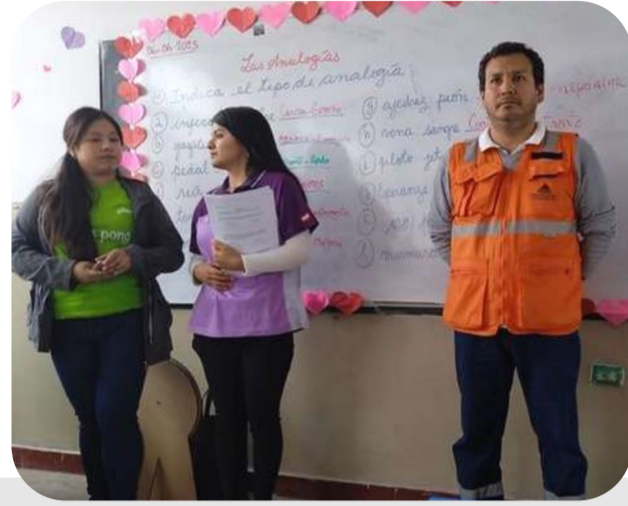
Zona centro I.E.P.20237 San Marcos de la Aguada

Programa Impactando Vidas: Test psicológico dirigido a estudiantes de 1er a 3er año de secundaria.