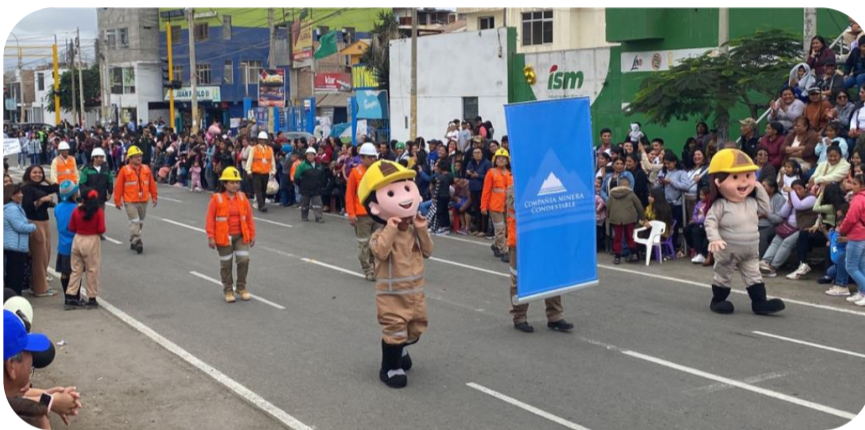
Participación en el Desfile Cívico Escolar por la Celebración del 202 Aniversario de Mala

Programa Impactando Vidas: Test psicológico dirigido a estudiantes de 1er a 3er año de secundaria.