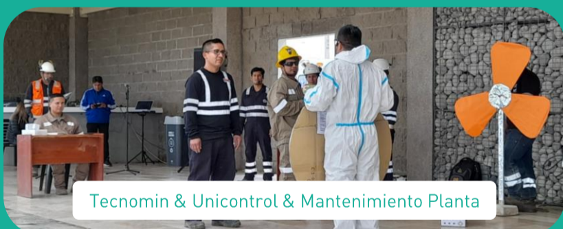
Tecnomin &amp; Unicontrol &amp; Mantenimiento Planta