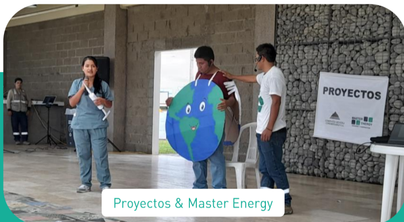
Proyectos &amp; Master Energy