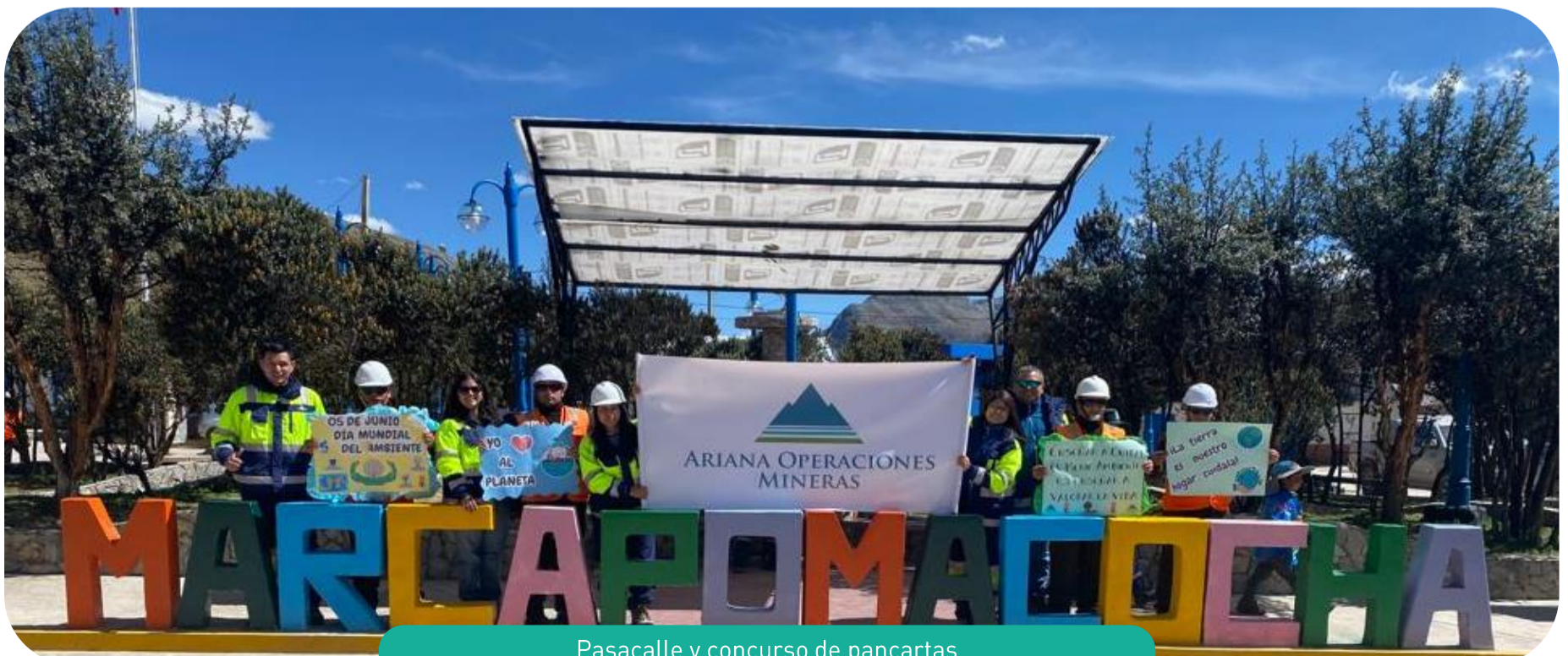
Pasacalle y concurso de pancartas Marcapomacocha, Yauli, Junín

En la misma línea, se realizó una charla de sensibilización y un taller de correcta segregación de residuos sólidos con los estudiantes de la I.E. N° 31917 “Héroes de Sangrar”, en el punto de acopio donado por Ariana Operaciones Mineras.