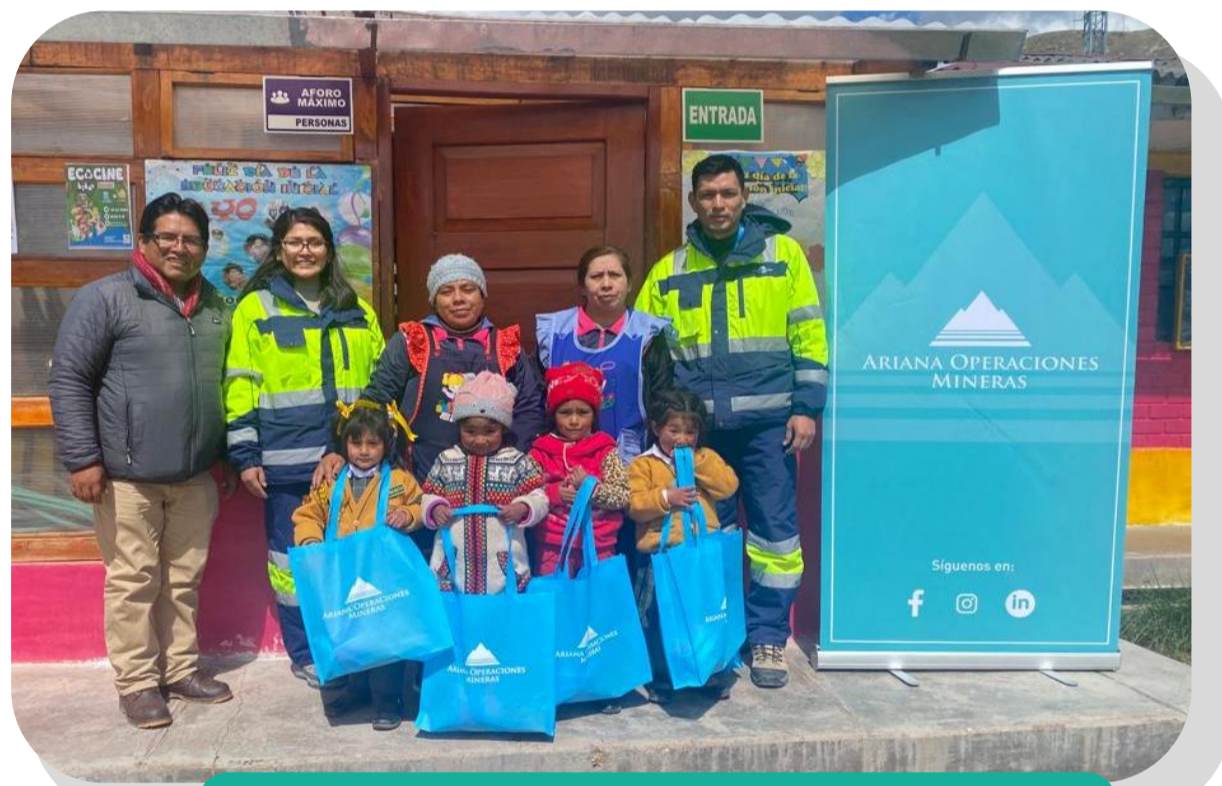
Feria Ecotrueque Marcapomacocha, Yauli, Junín