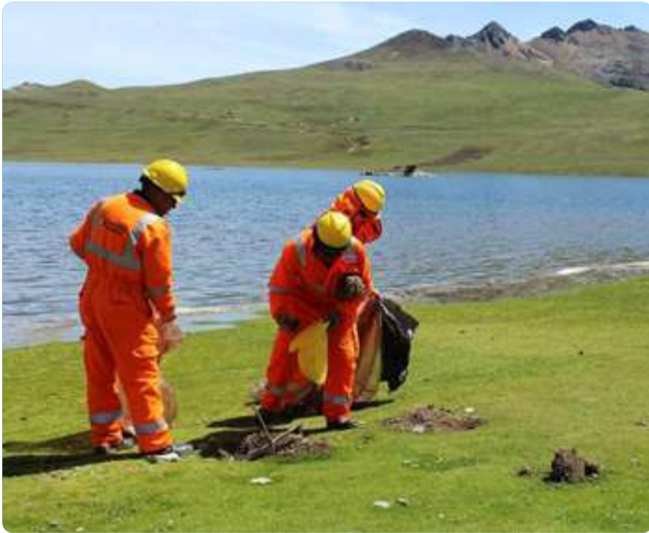
Campaña de limpieza de Laguna de Marcapomacocha Marcapomacocha - Yauli - Junín

¡Muchas gracias a todos los participantes!