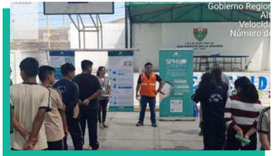
“Programa de Monitoreo Ambiental Participativo y Participación Ciudadana”: Taller Informativo dirigido a alumnos y profesores de la I.E.P. N° 20237