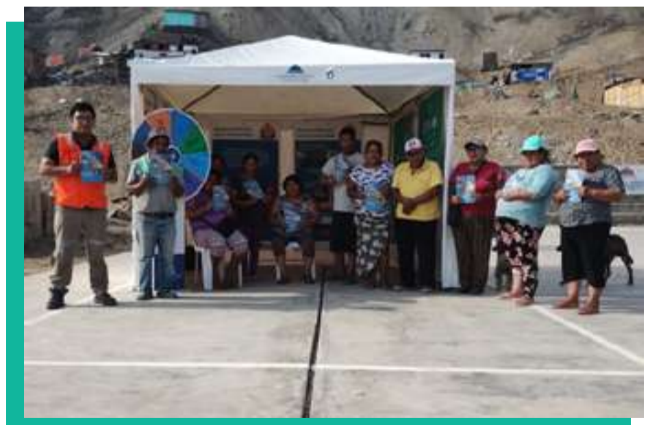
Atención en carpas informativas para brindar información sobre CMC a las poblaciones de la Zona Norte y Sur