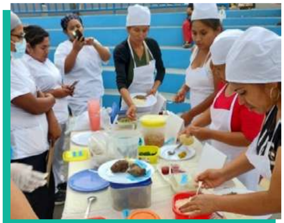
Campaña de Nutrición "Alimentación Saludable" - Zona Norte