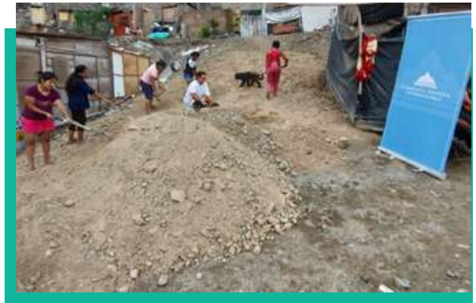
Apoyo en mejoramiento de vías - Anexo San Juan