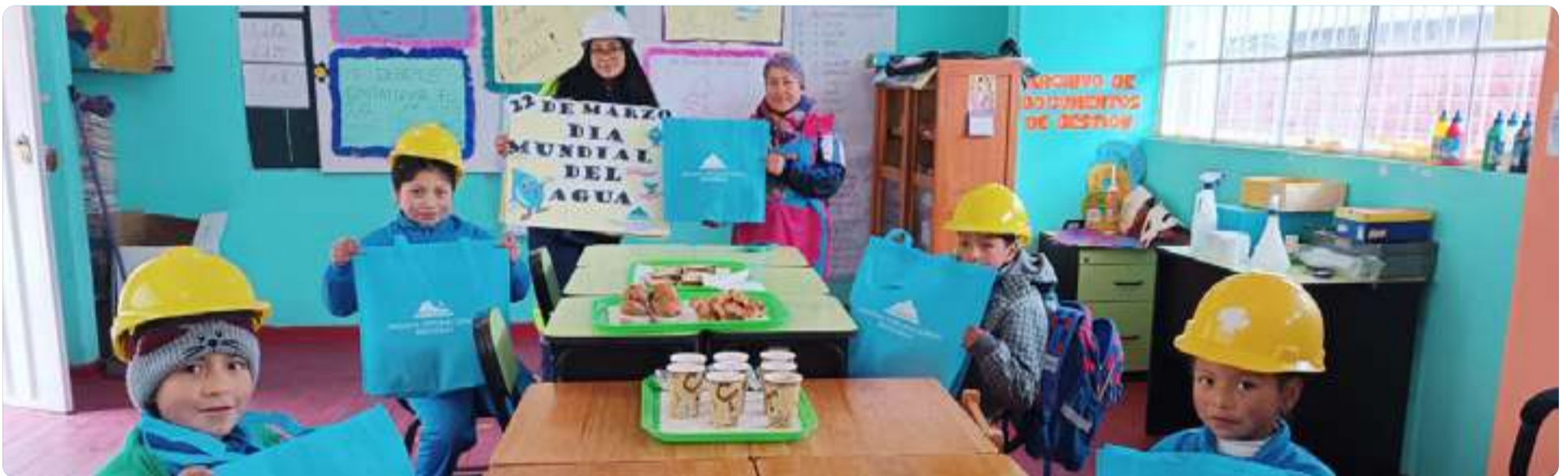
Concurso de pancartas I.E. N° 31258 Marcapomacocha - Yauli - Junín