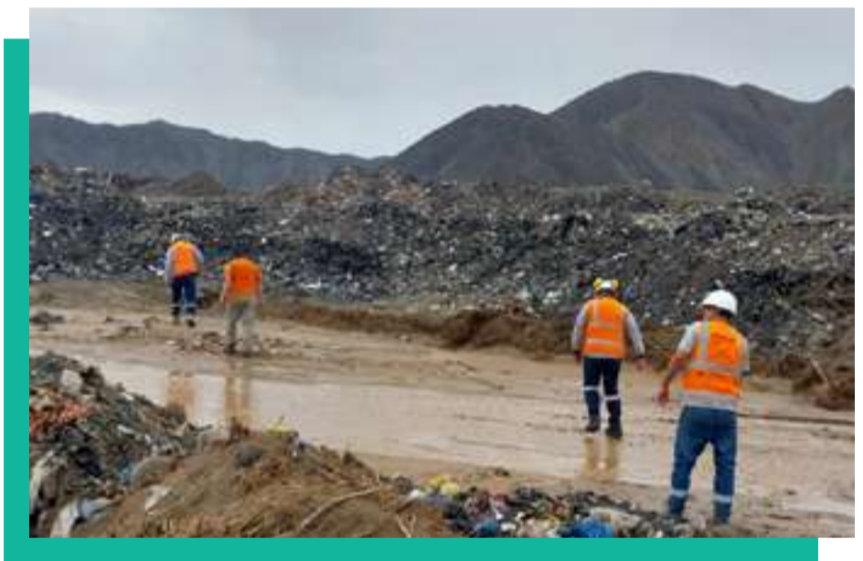
Apoyo con maquinaria para trabajos por estado de emergencia - Anexo 27 de Diciembre