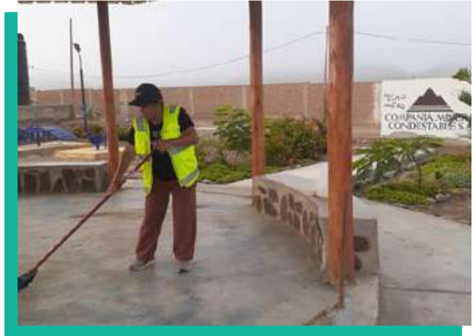
Faenas Urbanas: Orden y limpieza en los 6 anexos