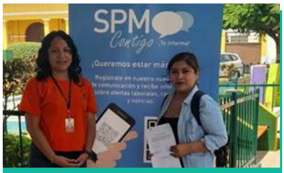
Apoyo económico a Sociedad Virgen Dolorosa de Mala