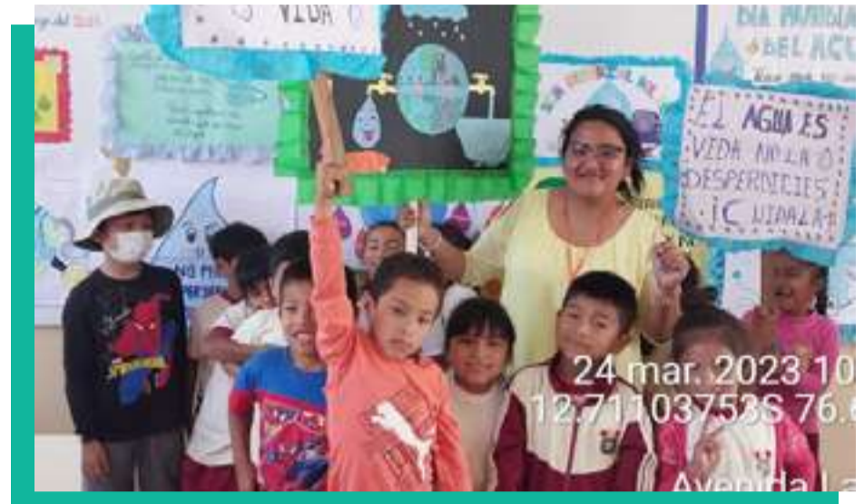
Charla por el Día Mundial del Agua - I.E.P. N° 20962 - Zona Sur