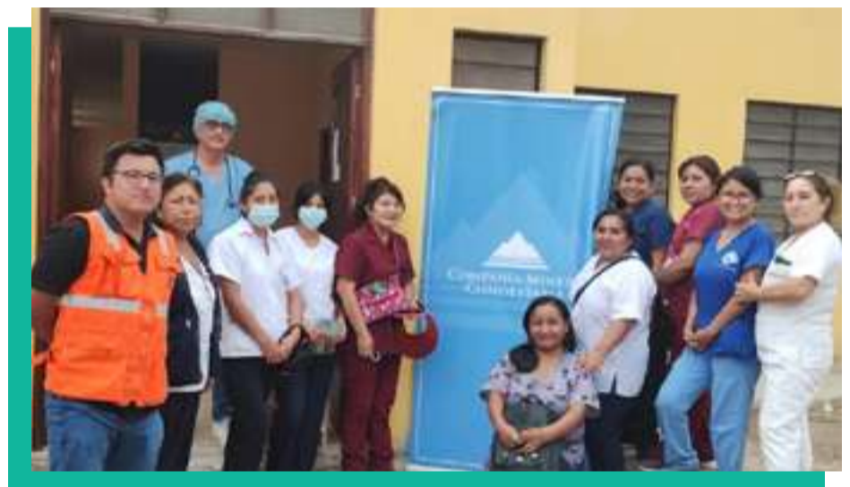
“Programa de Monitoreo Ambiental Participativo y Participación Ciudadana”: Capacitación a personal médico