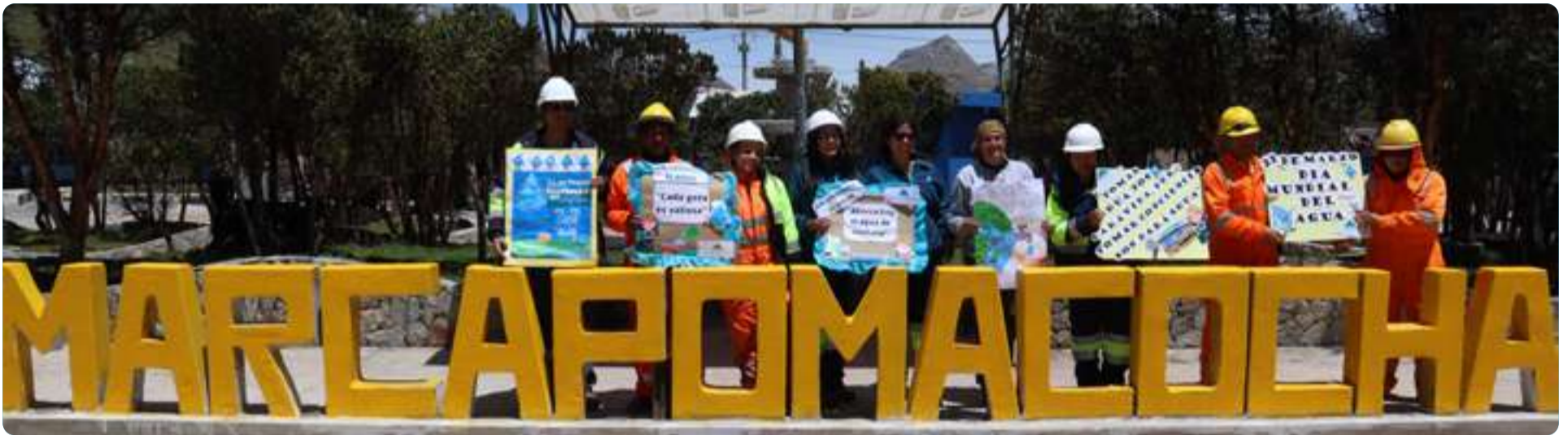
Pasacalle con pancartas por el Día Mundial del Agua Marcapomacocha - Yauli - Junín