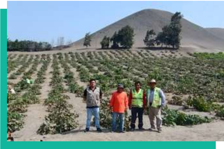
Cosecha de vid