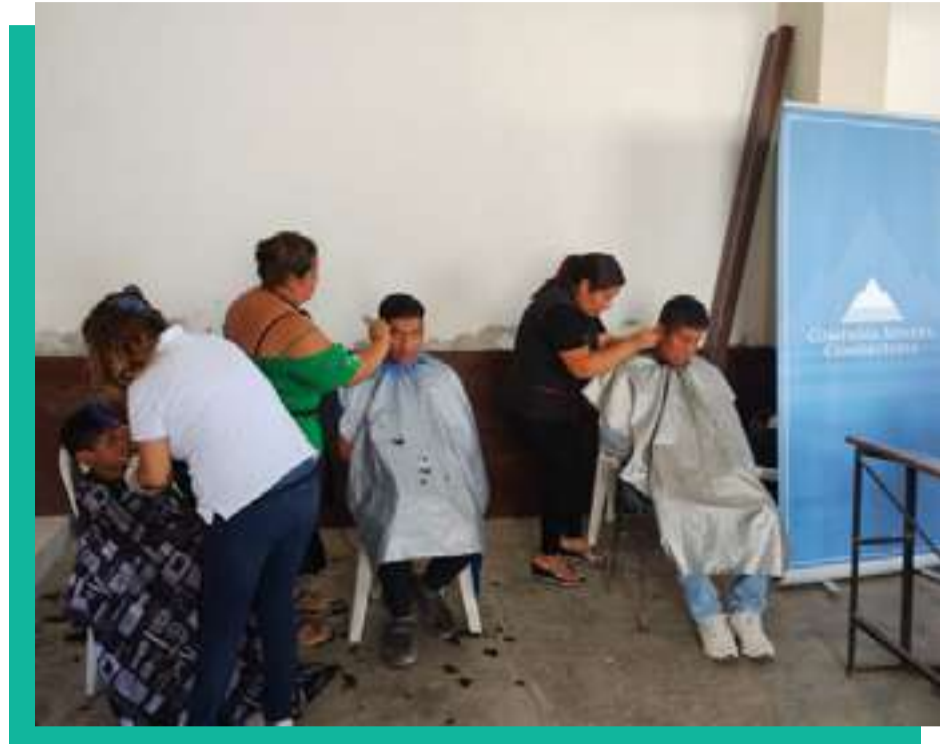
Campaña Médica y Campaña de Corte de Pelo - Zona Norte