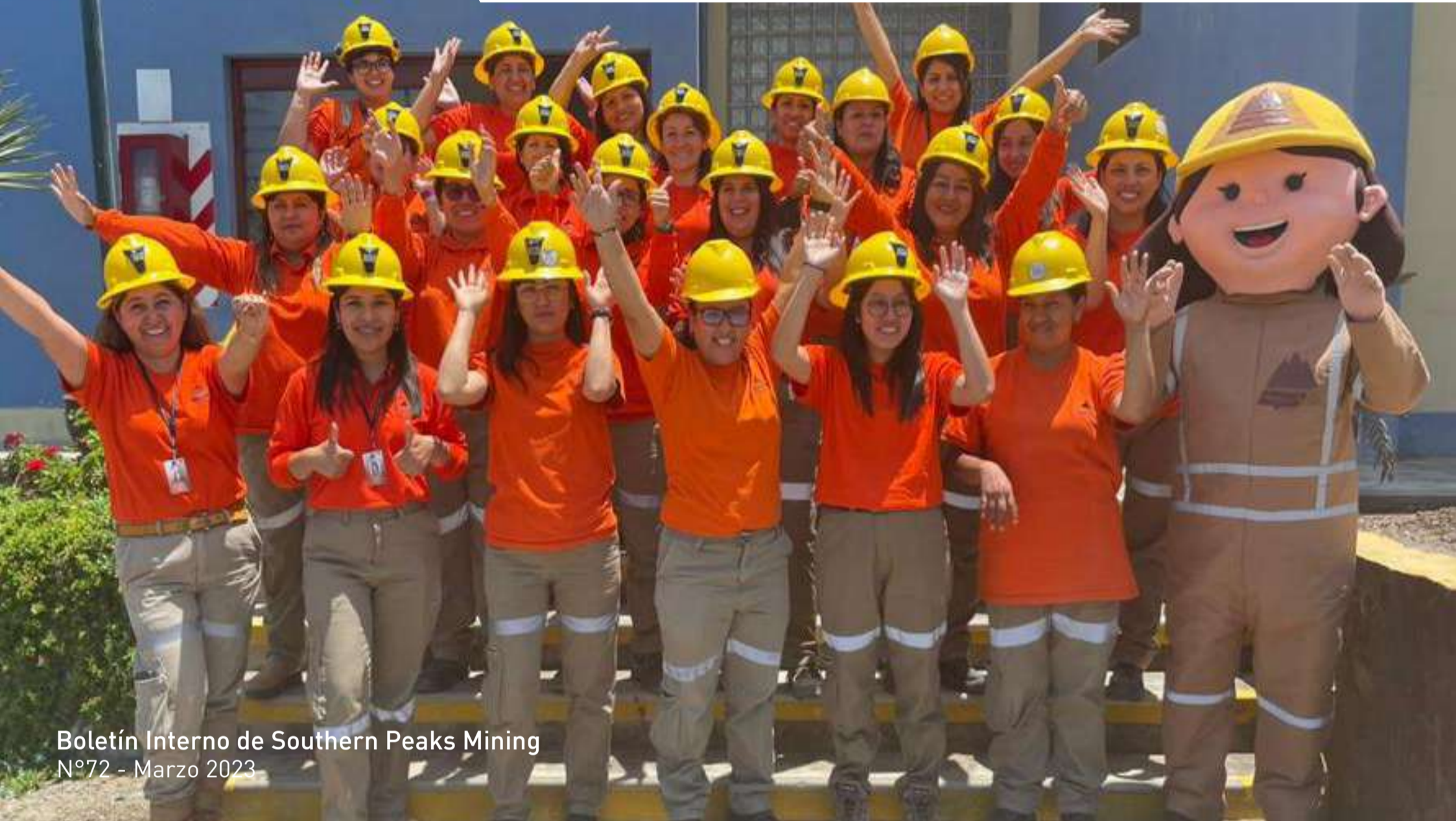
Boletín Interno de Southern Peaks Mining Nº72 - Marzo 2023