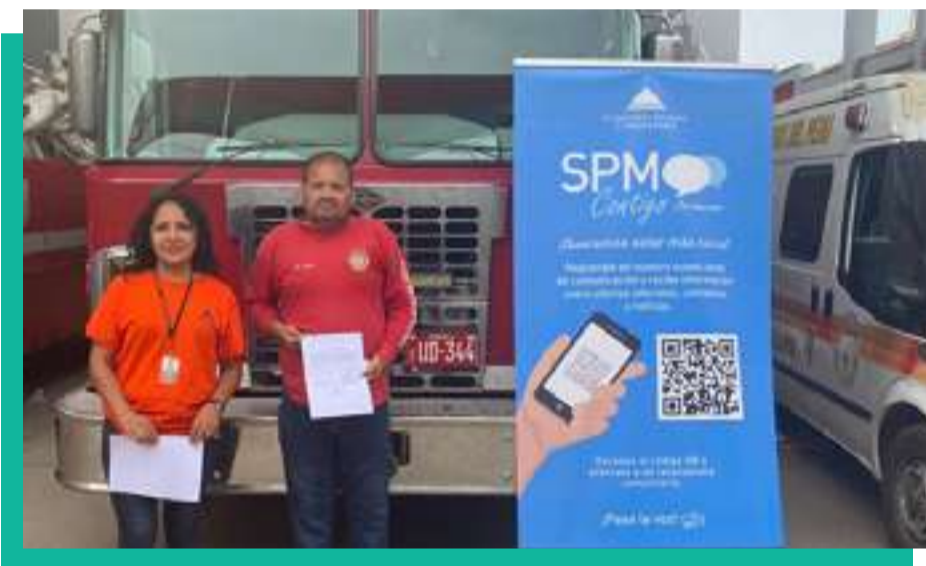
Apoyo económico a Compañía de Bomberos de Mala para reparación de Unidad