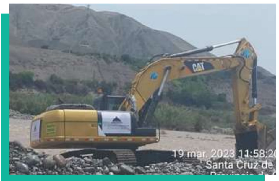
Apoyo a Municipalidad de Mala para trabajos con maquinaria pesada - Zona San José del Monte - Río Mala