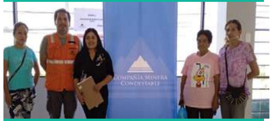
Capacitación de manejo seguro de agua potable en tiempos de Dengue y Covid Zona Norte - Centro - Sur