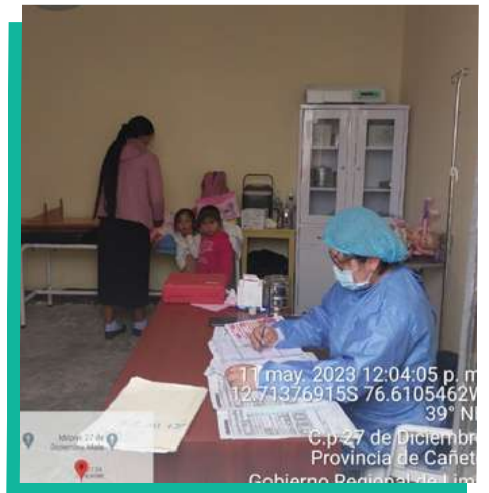
Apoyo logístico para campaña médica:

medicina general, nutrición, obstetricia, odontología, control y crecimiento, odontología, enfermería y farmacia - Zona Sur y Norte.