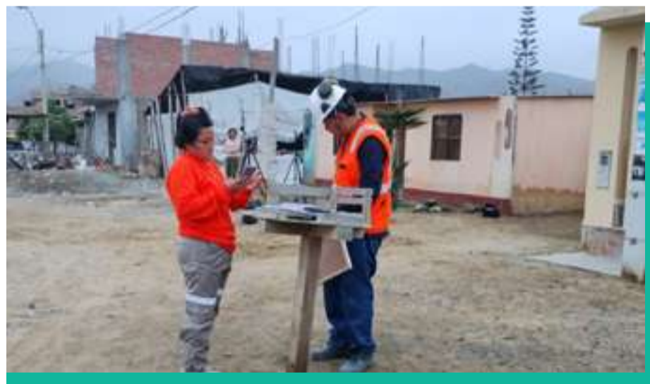
Monitoreo de ruidos y vibraciones en el anexo 27 de Diciembre – Zona Sur.