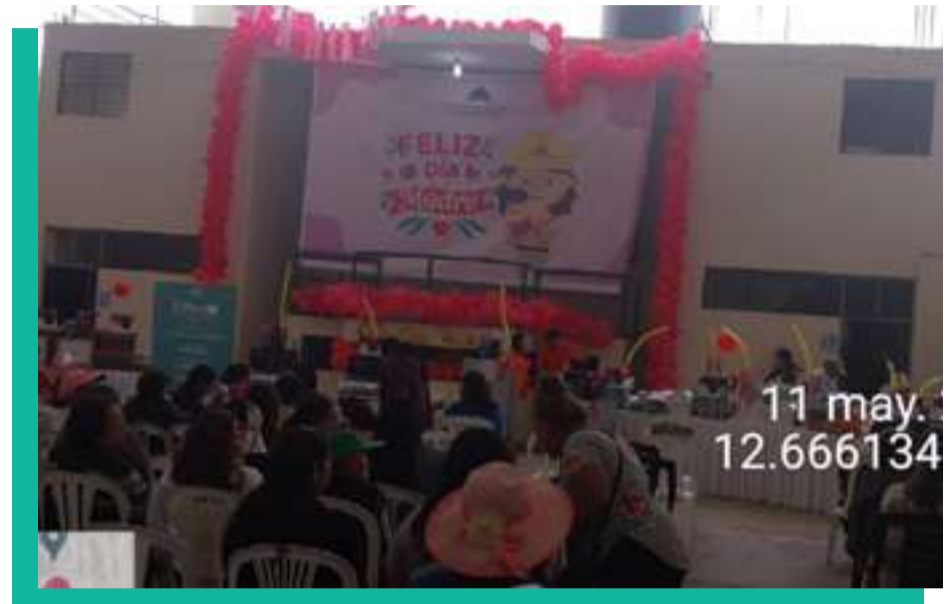
Agasajo por el día de la madre en el local comunal – Anexo San Marcos de la Aguada – Zona Centro