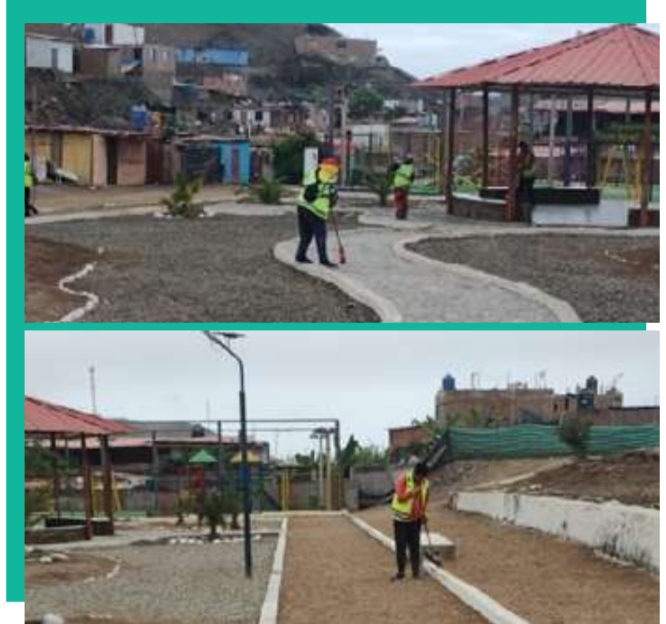
Faenas Urbanas: Orden y limpieza en los 6 anexos