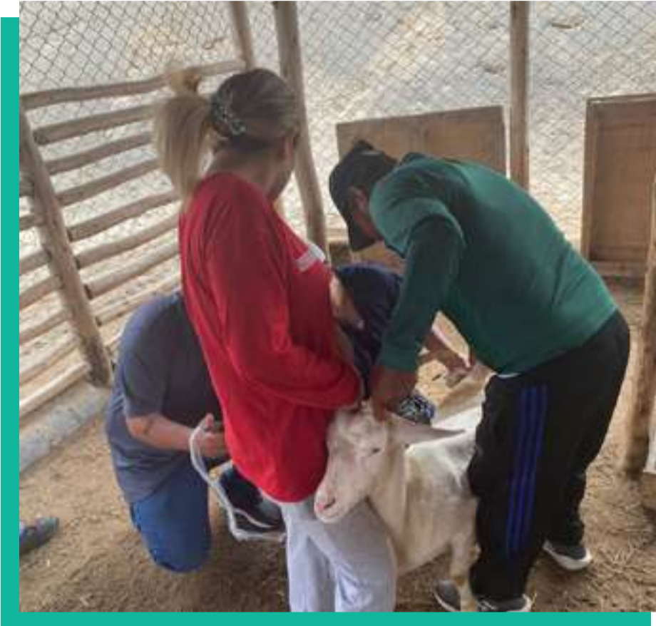
Faenas Ambientales: crianza de cabras y terreno agrícola