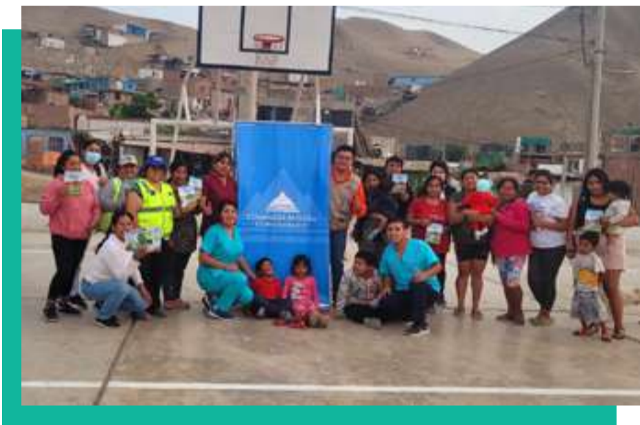
Sesión educativa de "Lucha contra el dengue" en coordinación con el puesto de salud de Dignidad Nacional - Anexo San Juan - Zona Centro