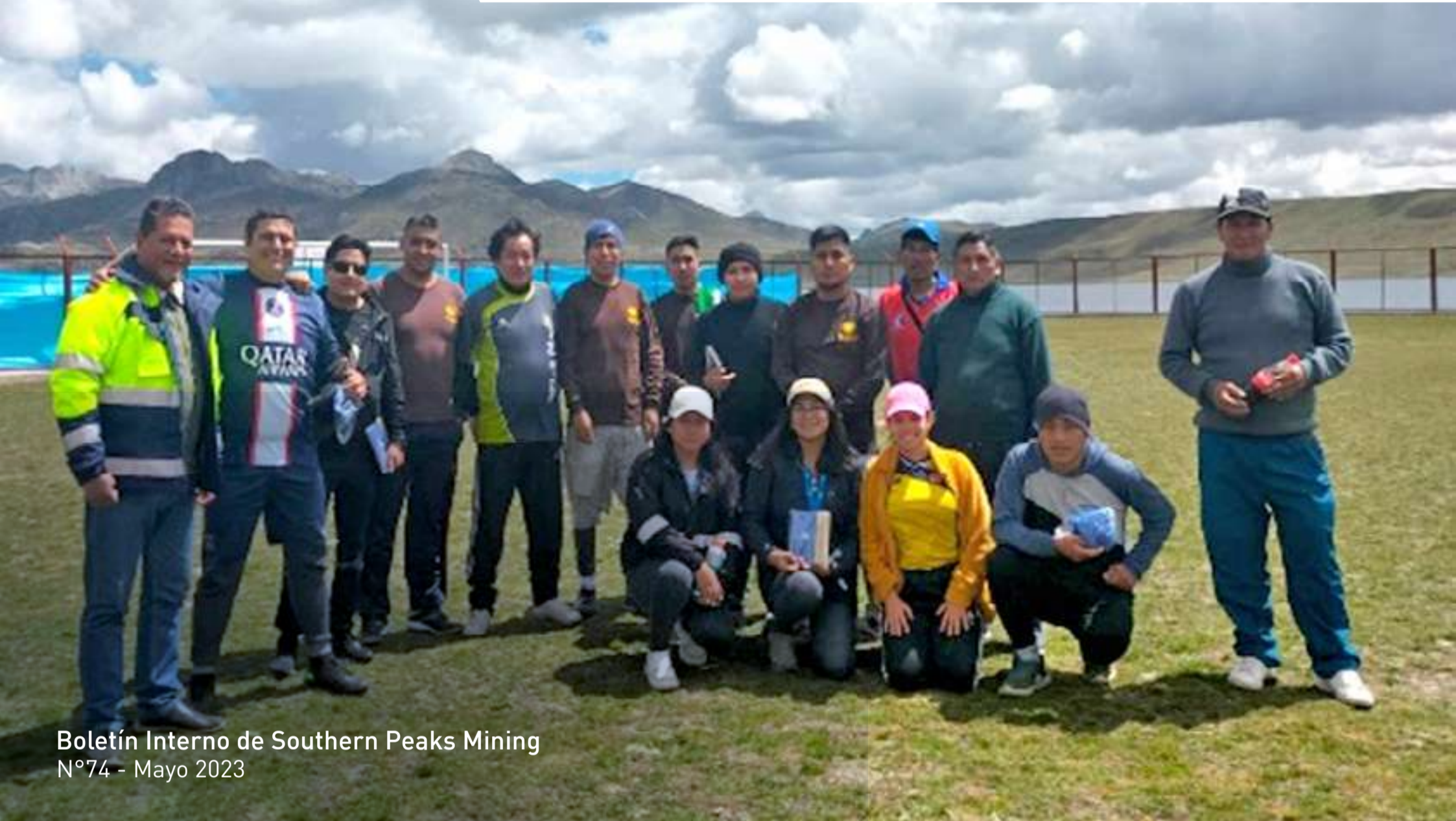
Boletín Interno de Southern Peaks Mining N°74 - Mayo 2023