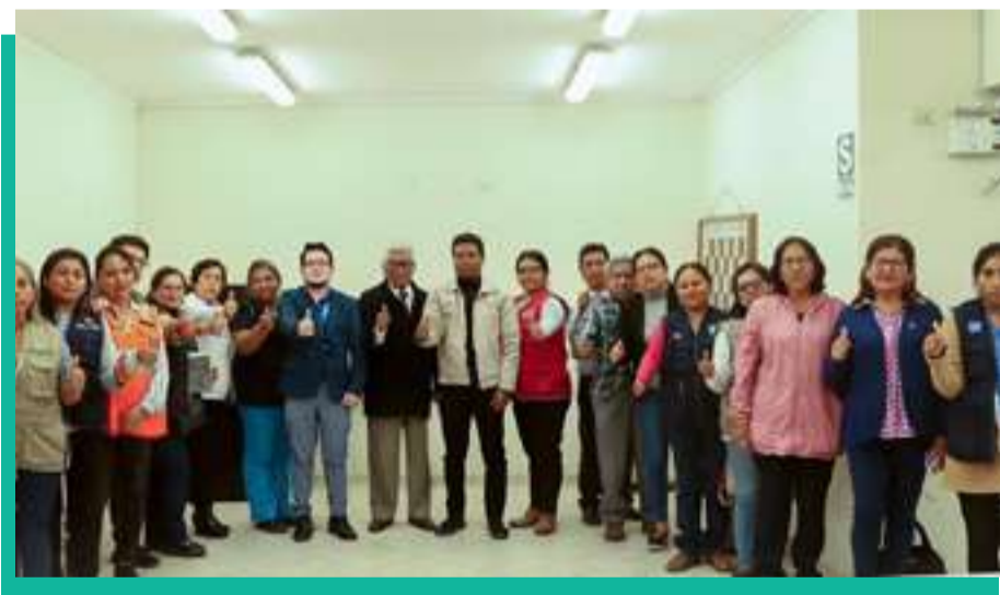
Participación de la Reunión Extraordinaria del Comité Multisectorial de Salud de Mala