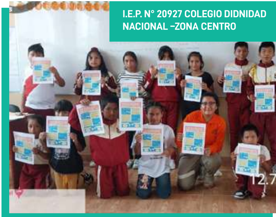
Taller de sensibilización por el día mundial contra el bullying y acoso escolar en la I.E.P. N° 20927