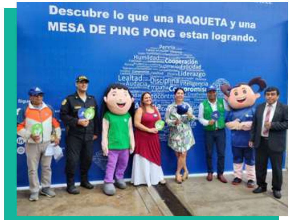
Inauguración del programa "Impactando Vidas" en la I.E.P. N° 20927 - Zona Centro.