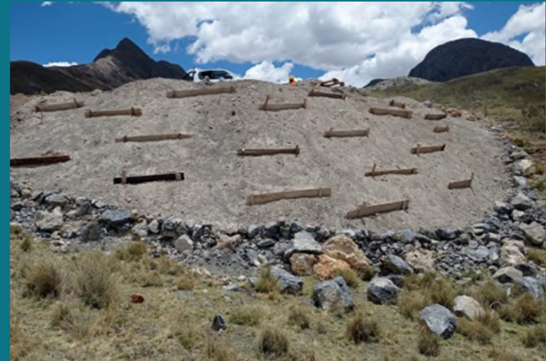
Estabilización de talud con enrocado y trincheras