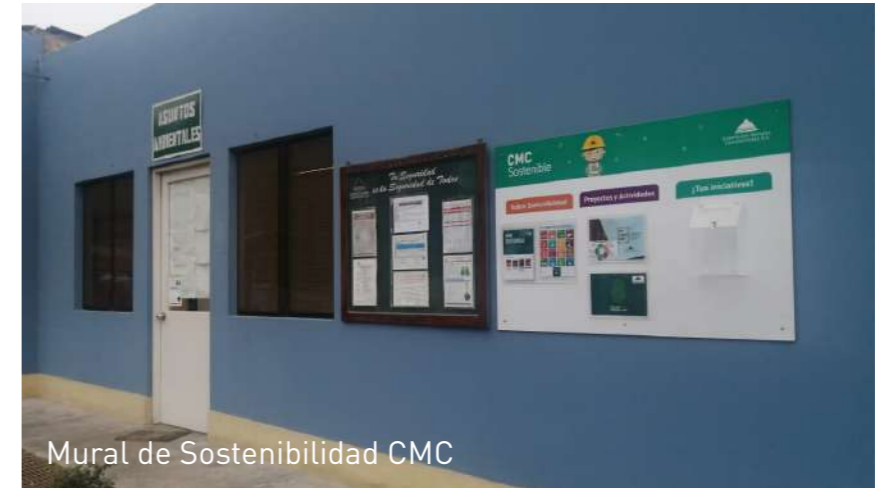
Mural de Sostenibilidad CMC