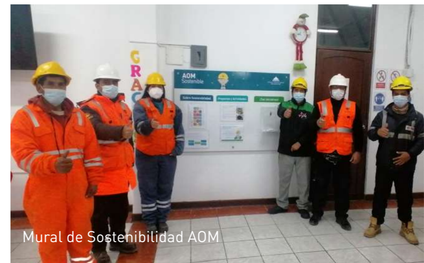
Mural de Sostenibilidad AOM