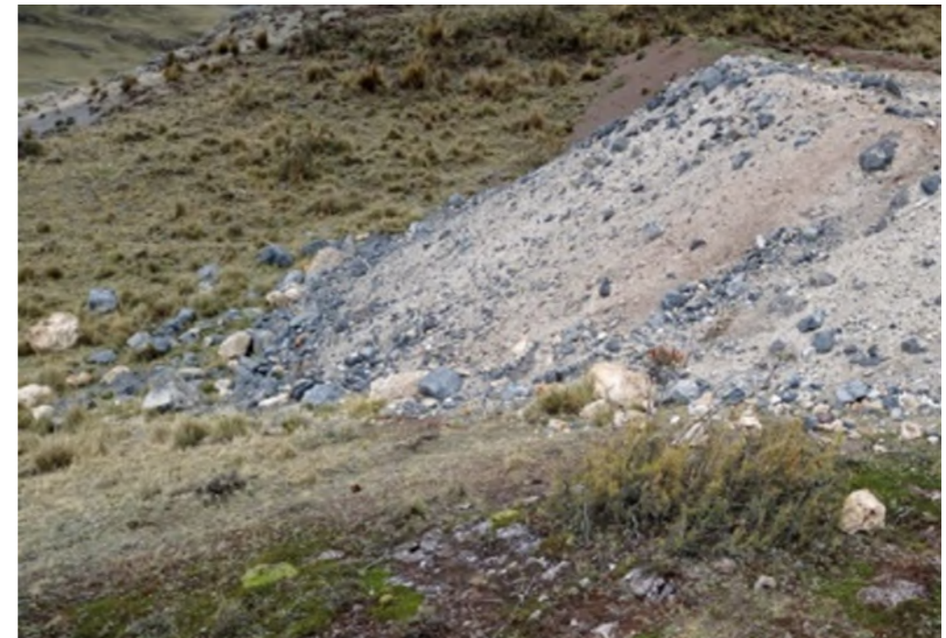
Área a ser rehabilitada

Todo esto nos permitirá contribuir a la conservación de la flora y fauna local.