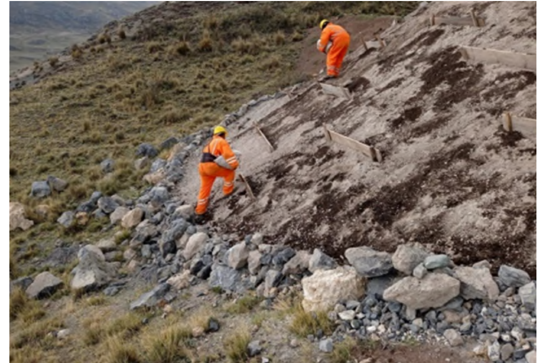
Colocación de top soil

Estas actividades se ejecutaron en 02 días con el apoyo de 02 colaboradores, utilizando recursos locales, reciclando madera y utilizando técnicas adecuadas para recuperar las áreas disturbadas. Este tipo de pilotos nos permite evaluar alternativas para el cierre de las futuras labores mineras.