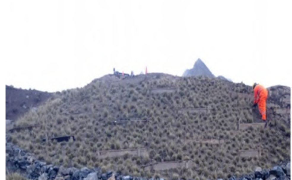
Área rehabilitada final