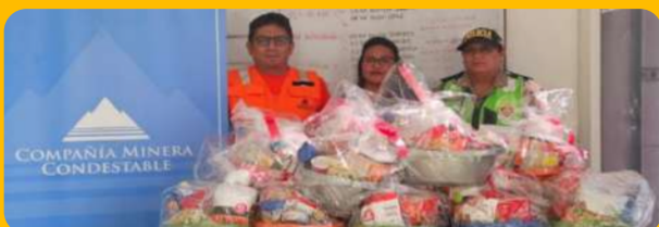
Comisaría de Mala.