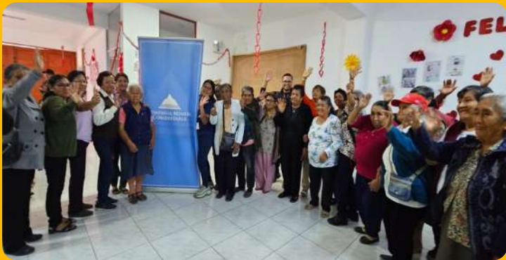
Taller psicológico – Centro Integral del Adulto Mayor

Realizamos un taller psicológico y pausas activas en el CIAM (Centro Integral del Adulto Mayor) de la Municipalidad Distrital de Mala.