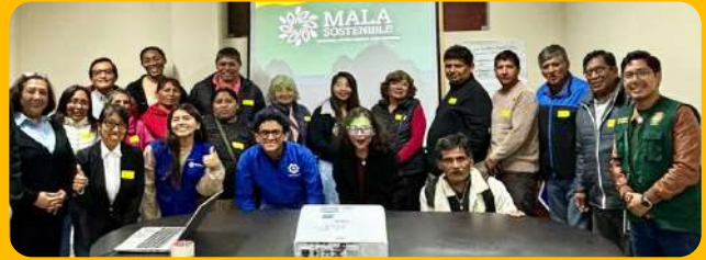
Reunión con la Subgerencia de Turismo y líderes sociales de Mala.

Se llevaron a cabo una serie de mesas de trabajo con el equipo de PROFONANPE y la Municipalidad Distrital de Mala, con el fin de coordinar con los líderes de los restaurantes y asociaciones culturales de Mala.