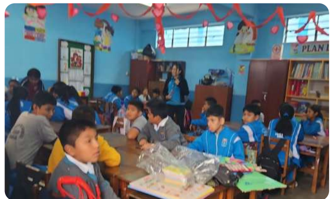
Charla nutricional – IEP 21015