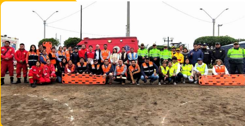
Simulacro Nacional Multipeligro – Distrito de Mala.

Participamos de las actividades previas al Simulacro Nacional Multipeligro. Nuestros relacionistas asistieron a un pasacalle destinado a fomentar la conciencia sobre la importancia de estar preparados ante desastres naturales en el distrito de Mala. Además, estuvimos presentes en el evento principal el 31 de mayo, donde pudimos observar el compromiso de varias instituciones locales de Mala en estas actividades de preparación.