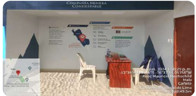
Módulo de atención OIP – CETPRO San Juan Bautista

Se retomó la atención en la Oficina de Información Permanente en Mala, mediante un Convenio Interinstitucional con el CETPRO San Juan Bautista, el cual nos permitirá reforzar nuestros canales de comunicación en la zona de influencia.