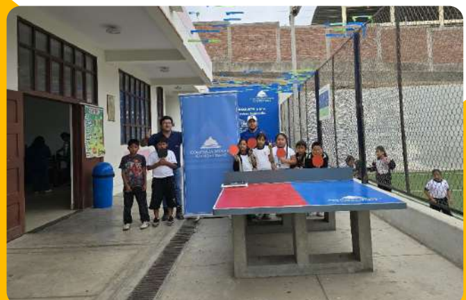
Clases de Ping Pong – Colegio de Dignidad Nacional 20927