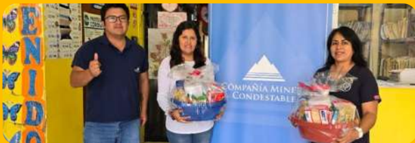
Centro de Salud Mental Comunitario Valle La Esperanza.