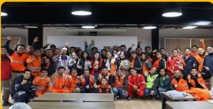
Taller de ANIQUEM en CMC.

Participamos de la charla brindada por ANIQUEM, para incentivar el correcto reciclaje de los residuos. Este taller fue liderado por el equipo de Medio Ambiente, y contó con la participación de todas las áreas de CMC.