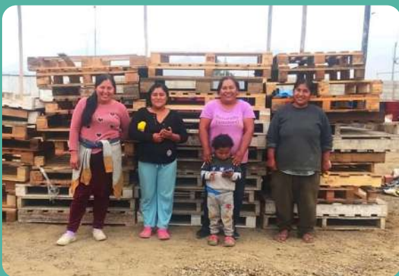
Entrega de parihuelas – PRONOEI El Palmo

Se llevó a cabo la donación de 60 parihuelas al PRONOEI El Palmo para la elaboración de un cerco perimétrico en coordinación con los padres de familia de la institución.