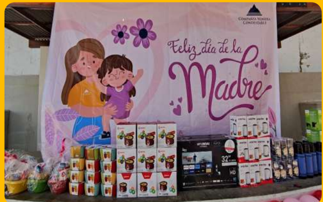
Presentes entregados – Colegio Dignidad Nacional.