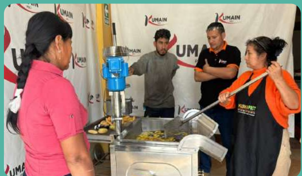
Taller de capacitación técnica a la asociación ECOPED.