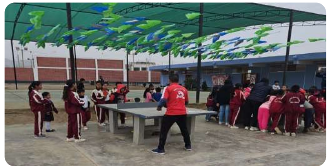
Clases de ping-pong – Colegio 27 de diciembre

Se viene desarrollando el Programa Impactando Vidas, que promueve la práctica deportiva de ping pong y fomenta la nutrición saludable en colegios de la Comunidad Campesina de Mala y del distrito de Mala, dentro de nuestra área de influencia social.