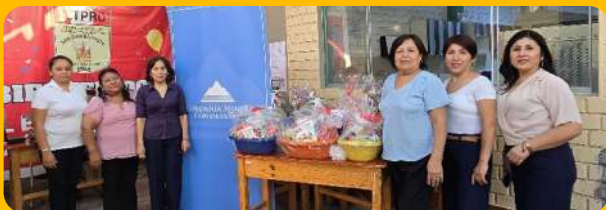
CETPRO San Juan Bautista.