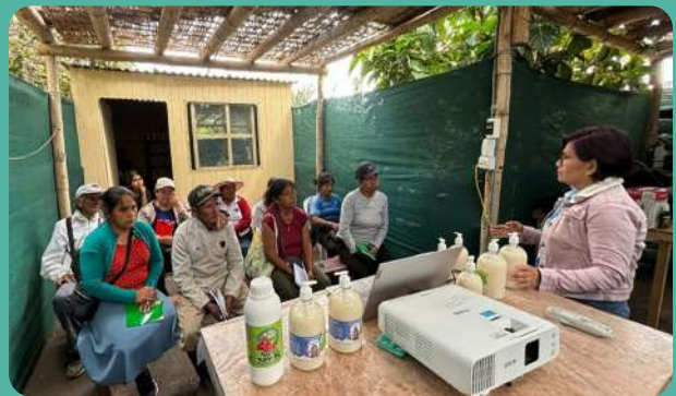
Taller de capacitación técnica a la asociación PROBIMA.

El equipo de PROFONANPE lleva a cabo una serie actividades de producción y capacitación con las asociaciones PROBIMA y ECOPED, con la finalidad de afianzar nuestro compromiso con el valor compartido y la economía circular.