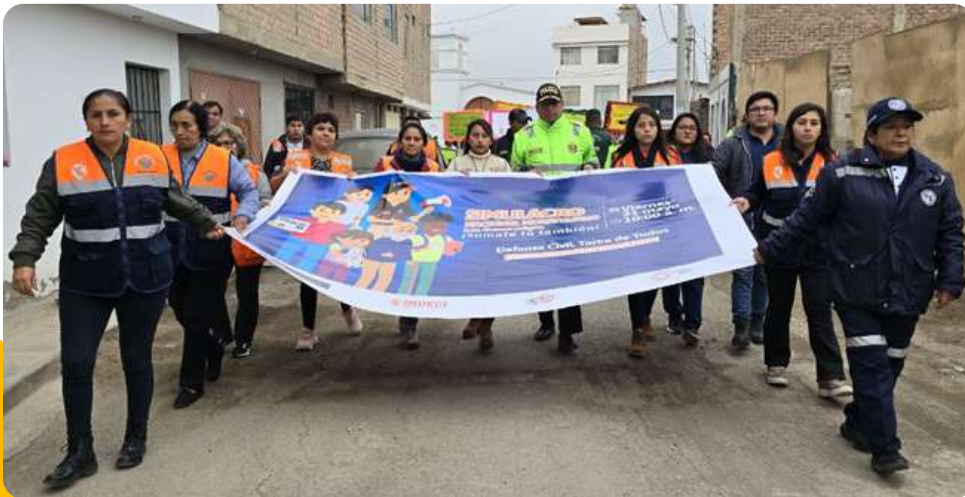
Pasacalle por el Simulacro Nacional Multipeligro – Distrito de Mala.