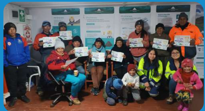
Charla de medioambiente / Marcapomacocha – Yauli - Junín / 16.05.2024