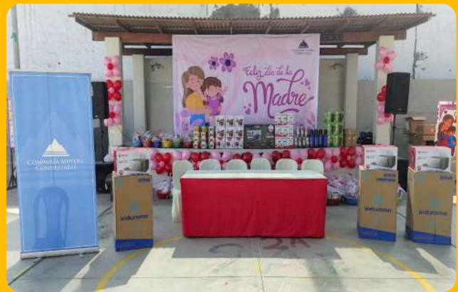
Evento por el Día de la Madre – Colegio Dignidad Nacional.

Se llevó a cabo la entrega de canastas por el Día de la Madre a las instituciones locales aliadas en nuestras iniciativas de gestión social en el área de influencia social.