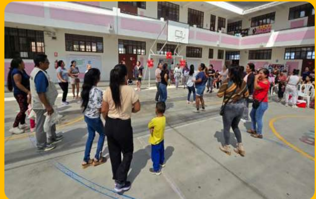
Baile y agasajo – Colegio Dignidad Nacional.