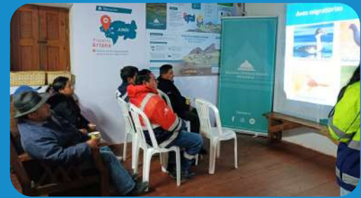
Charla de medioambiente / Carampona – Huarochirí – Lima / 15.05.2024