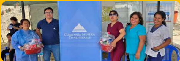
Puesto de Salud Dignidad Nacional.